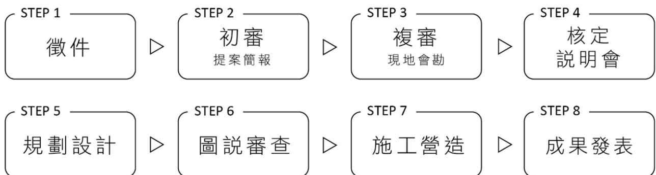
圖 1 計畫執行流程圖

以影像記錄執行過程，並透過記者會或其他形式，公開發表本案成果，介紹合作學校之原住民族文化學習場域營造成效，作為計畫示範學校。